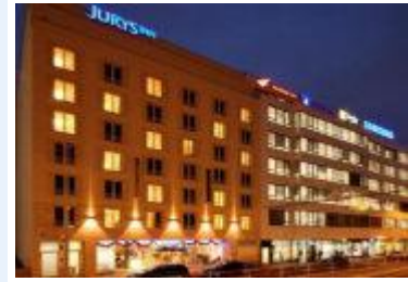
Hotel Jurys INN. (Praga)