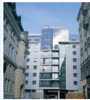
Hotel NH Budapest. (Budapest)

Desayuno y a la hora indicada traslado al aeropuerto para tomar vuelo de regreso a su lugar de origen.